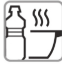
OLIS DE FREGIR